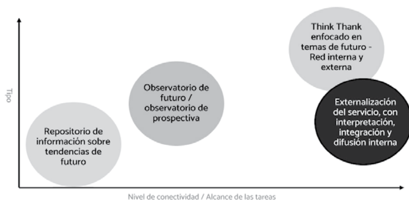
Organización de la Prospectiva Estratégica en las organizaciones. Tipología.