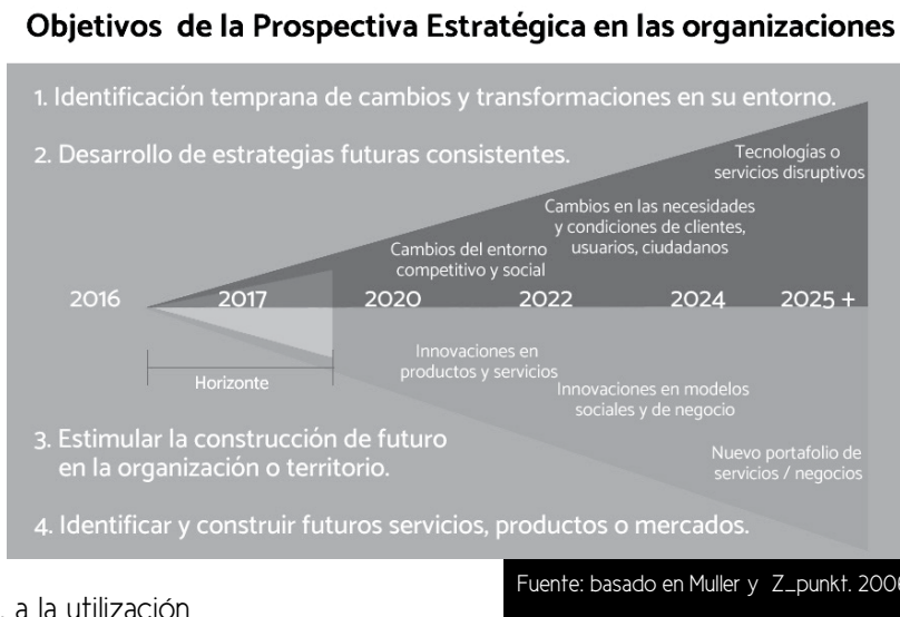
Figura 2. Objetivos de la prospectiva estratégica

Por otra parte, objetivos más relacionados con estimular la construcción de futuro de la organización y la identificación, diseño y construcción de futuros nuevos servicios, nuevos productos o nuevos mercados.