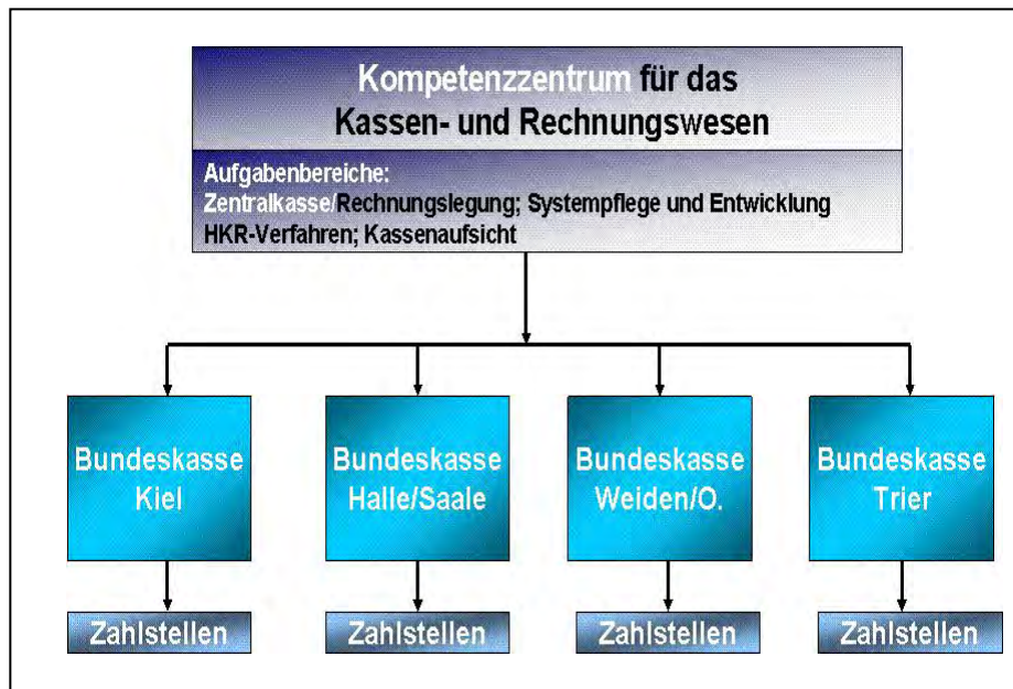
GRÁFICO No. 1

En la actualidad existen cuatro cajas federales que dependen y centralizan sus fondos en la CFP, de conformidad como se describe en el siguiente gráfico.