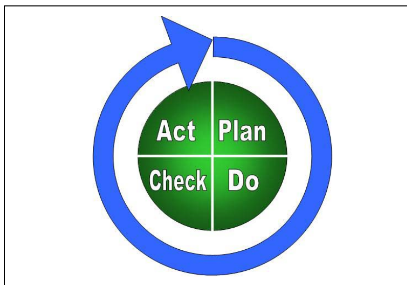
GRÁFICO No. 3 CÍRCULO DE DEMING