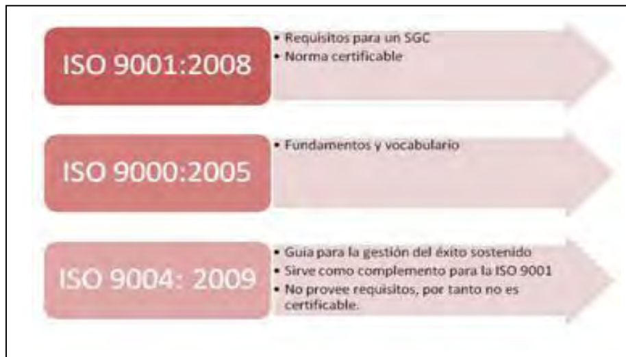
GRÁFICO No. 1 FAMILIAS DE NORMAS ISO 9000